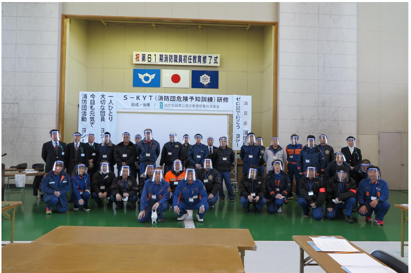
1 ~ 6 班 の 皆 様