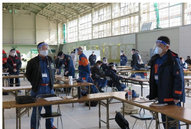
研 修 風 景