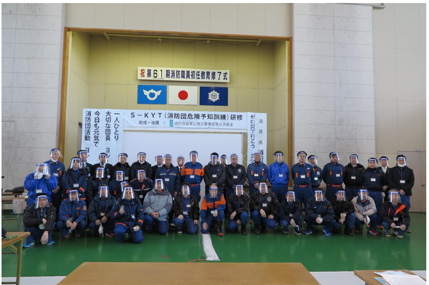
7 ~ 12 班 の 皆 様